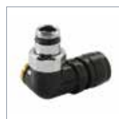
Schwarz glänzend 550S321800