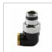
Schwarz glänzend 550S321900