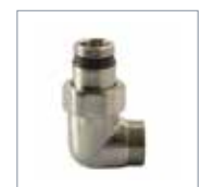
Edelstahloptik matt 550S321700