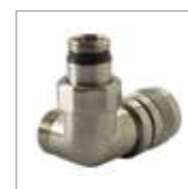
Edelstahloptik matt 550S321600